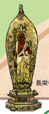
長栄寺十一面観音立像