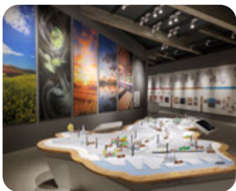
市内歴史フィールドへ