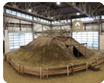
古代の暮らし体験