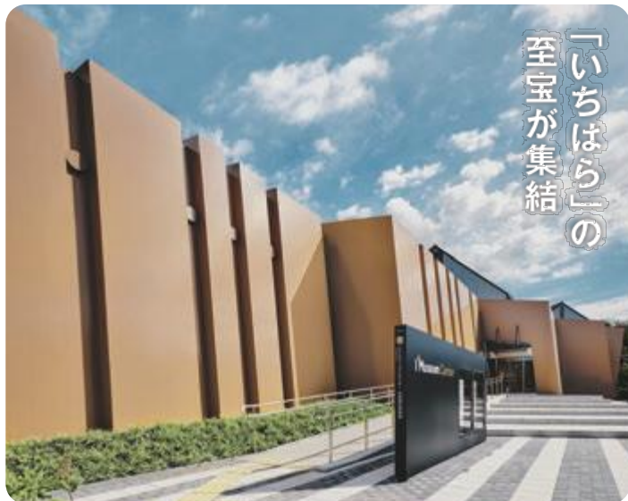
市原歴史博物館 外観