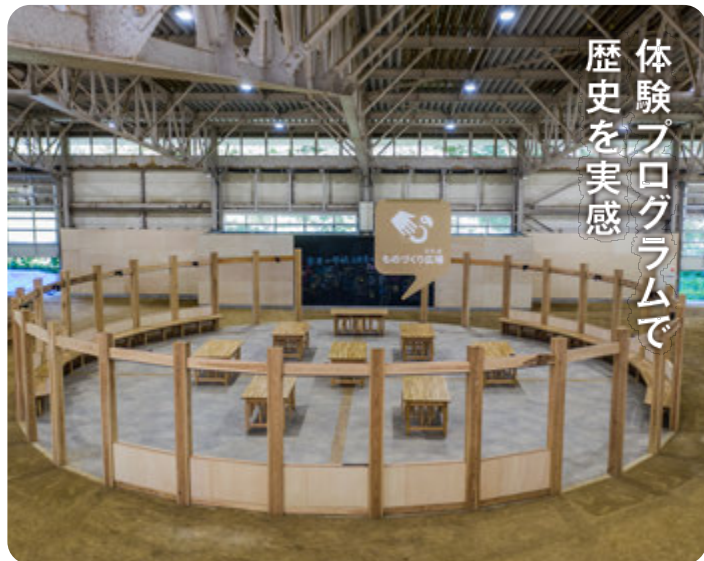
歴史体験館 ものづくり広場