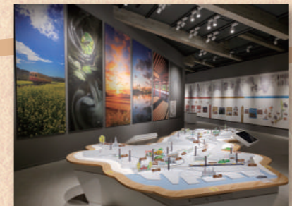
市原歴史博物館エントランスホール