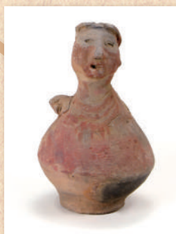
人面付土器 郡本遺跡群 (三嶋台地区)出土